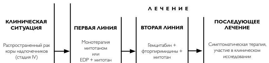
Рисунок 2. Лечение распространенного рака коры надпочечников.