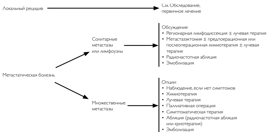
Рисунок 3. Рекомендуемый алгоритм лечения рецидивов сарком мягких тканей