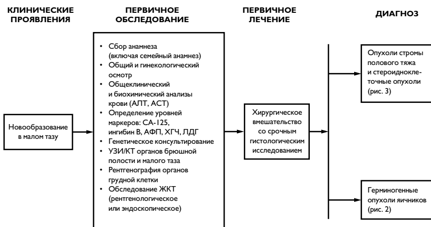
Рисунок 1. Первичное обследование пациентки с опухолями яичников.