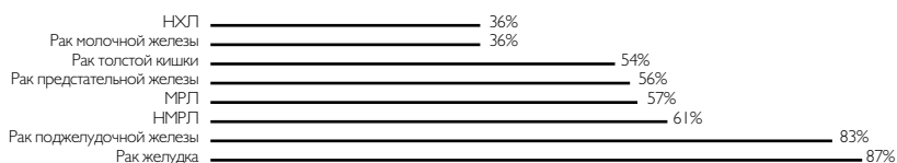
Рисунок 1. Распространенность синдрома анорексии-кахексии у онкологических больных.

Последствия синдрома анорексии-кахексии: