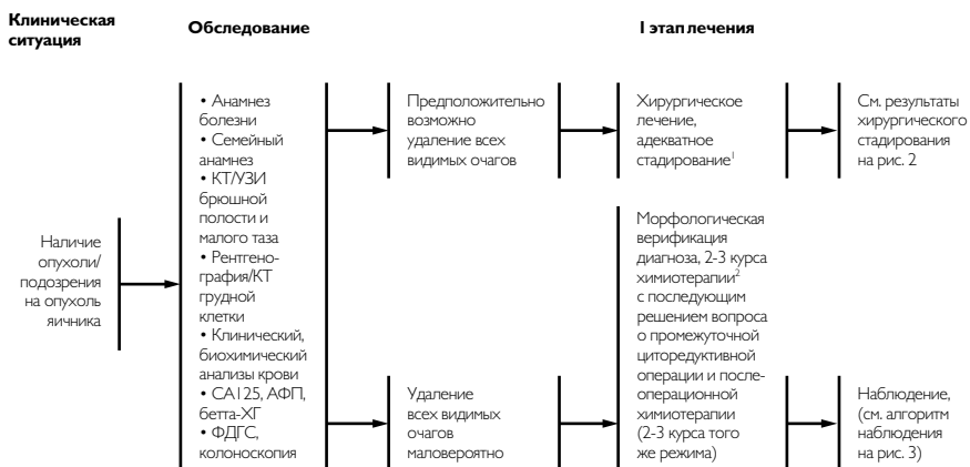
Рис. 1. Обследование и планирование лечения при первичном раке яичников.

Существует достаточное количество доказательств эффективности паллиативного облучения с частотой объективных эффектов до 85% у больных раком яичников, прогрессирующим после множества линий химиотерапии. Это свидетельствует о целесообразности применения лучевой терапии на прогрессирующие очаги опухоли при отсутствии перспектив лекарственного лечения.