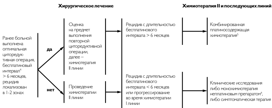
Рис. 4. Лечение рецидивов рака яичников.

4 Режимы химиотерапии второй линии представлены в таблице 3.