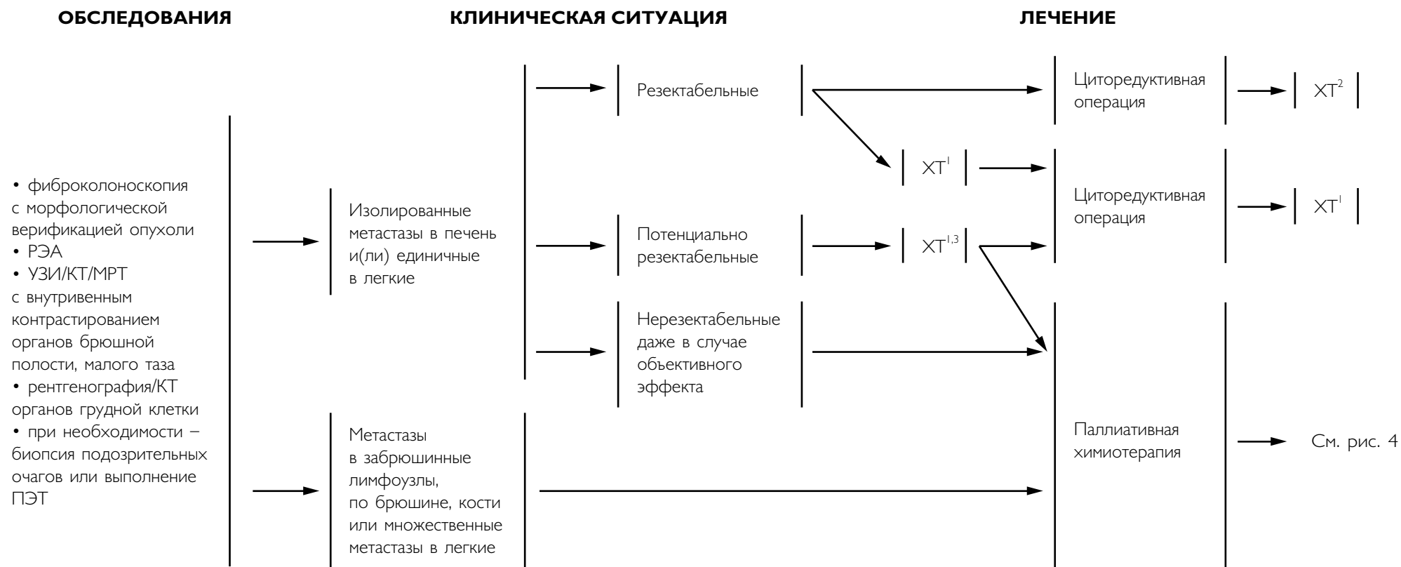
Рис. 3. Обследование и планирование терапии при диссеминированном РТК (IV стадия)