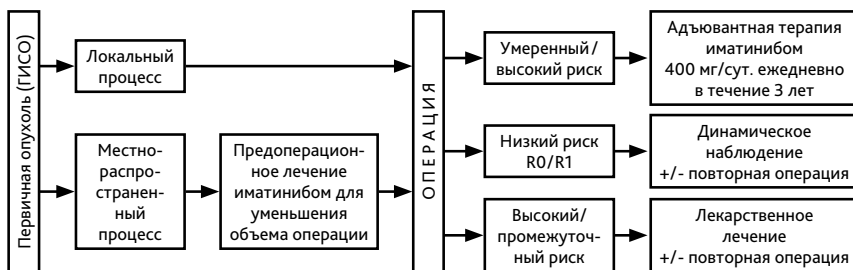
Рисунок 1. Алгоритм лечения операбельных форм гастроинтестинальных стромальных опухолей.

С учетом редкой встречаемости ГИСО не проводятся.