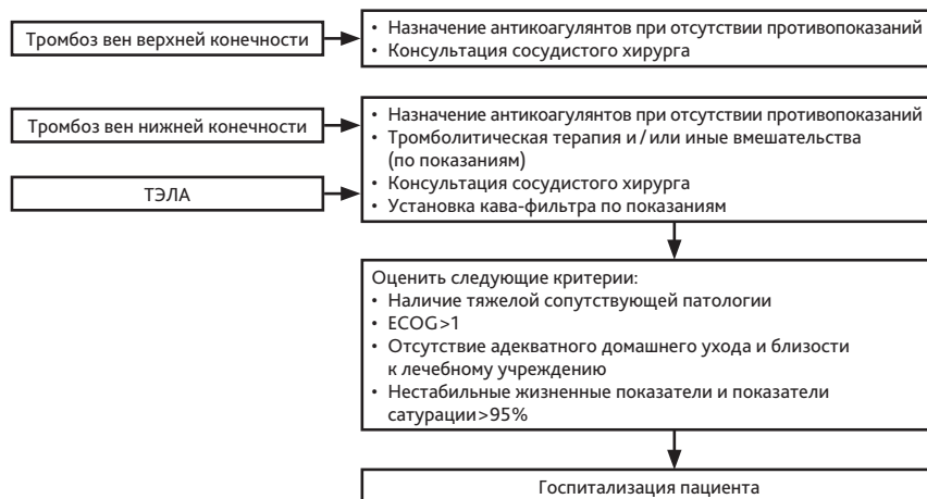
Рисунок 2. Тактика врача при развитии ВТЭО.