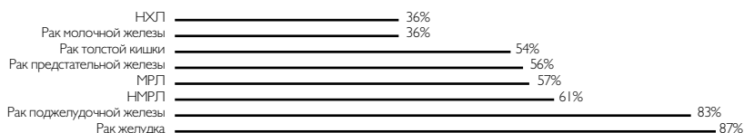
Рисунок 1. Распространенность синдрома анорексии-кахексии у онкологических больных.

Последствия синдрома анорексии-кахексии: