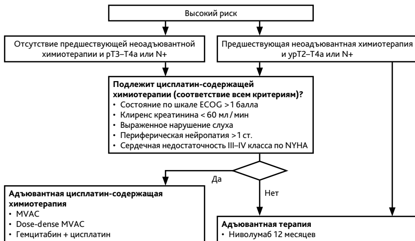
Рисунок 2. Алгоритм адьювантной терапии больных мышечно-инвазивным раком мочевого пузыря с высоким риском рецидива.