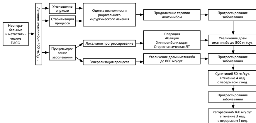
Рисунок 2. Алгоритм лечения неоперабельных и метастатических форм гастроинтестинальных стромальных опухолей.